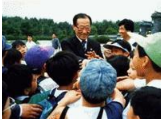
Chung Ju Yung năm 1992