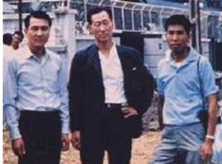
Chung Ju Yung (giữa) tại VN năm 1966

TT - Hồi còn làm lao động ở bến cảng Incheon, tôi đã ở trọ một nơi đúng là thiên đường cho rệp trú ngụ. Rệp nhiều đến mức không thể ngủ được dù rằng cơ thể rã rời sau một ngày làm việc nặng nhọc.